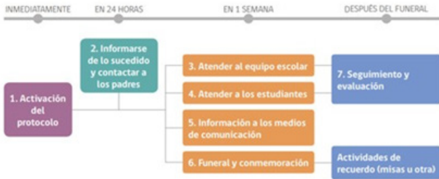
Diagrama con los 7 pasos a seguir tras la muerte por suicidio