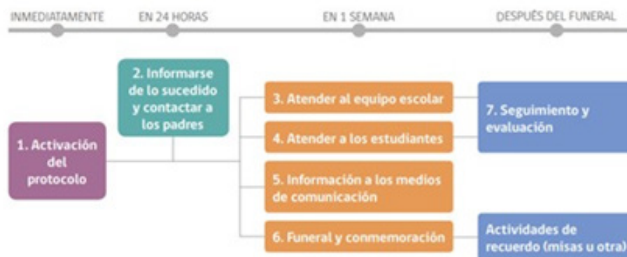
Diagrama con los 7 pasos a seguir tras la muerte por suicidio