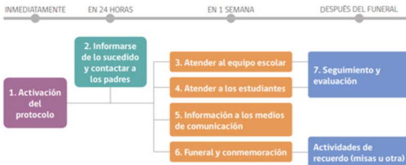
Diagrama con los 7 pasos a seguir tras la muerte por suicidio