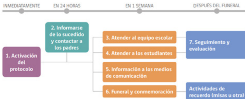
Diagrama con los 7 pasos a seguir tras la muerte por suicidio